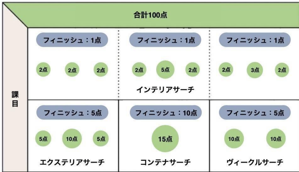
図4 NW3の点数配分の例